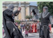
Astorica Città di Albino