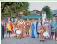
Pro Loco Pontida