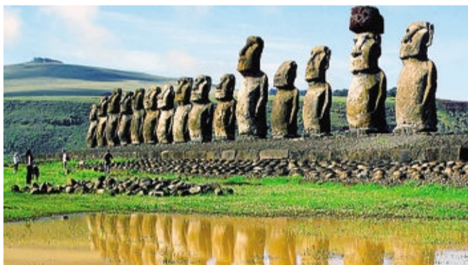
I giganteschi Moai dell'Isola di Pasqua: uno verrà realizzato a Chiuduno

I Moai sono statue che si trovano sull'Isola di Pasqua. Nella maggior parte dei casi si tratta di statue monolitiche, cioè ricavate e scavate da un unico blocco di tufo vulcanico; alcune possiedono sulla testa un tozzo cilindro (pukao) ricavato da un altro tipo di tufo di colore rossastro, interpretato come un copricapo oppure come l'acconciatura un tempo diffusa tra i maschi. I Moai sono alti da 2,5 metri fino a 10